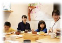
食事の支援の様子