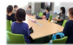
(親子関係形成支援)