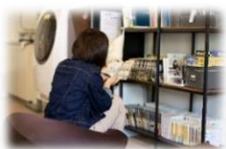
中高生向けのフリースペースの様子