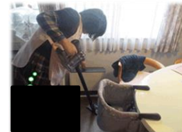
家事支援のイメージ