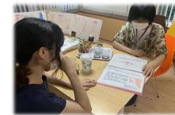
(支援の必要性の高い妊産婦の支援)