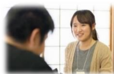
専門職による面談の様子