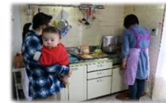
(訪問家事育児支援)