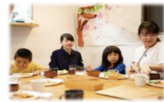
(子どもの居場所支援)