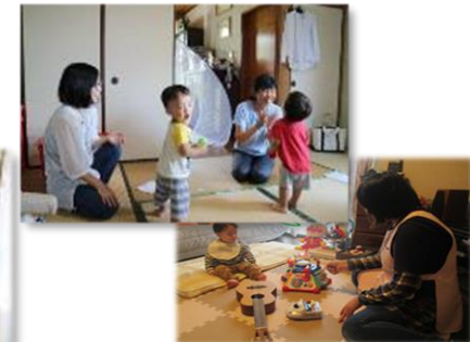
育児支援のイメージ