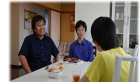
(社会的養護経験者の自立支援)